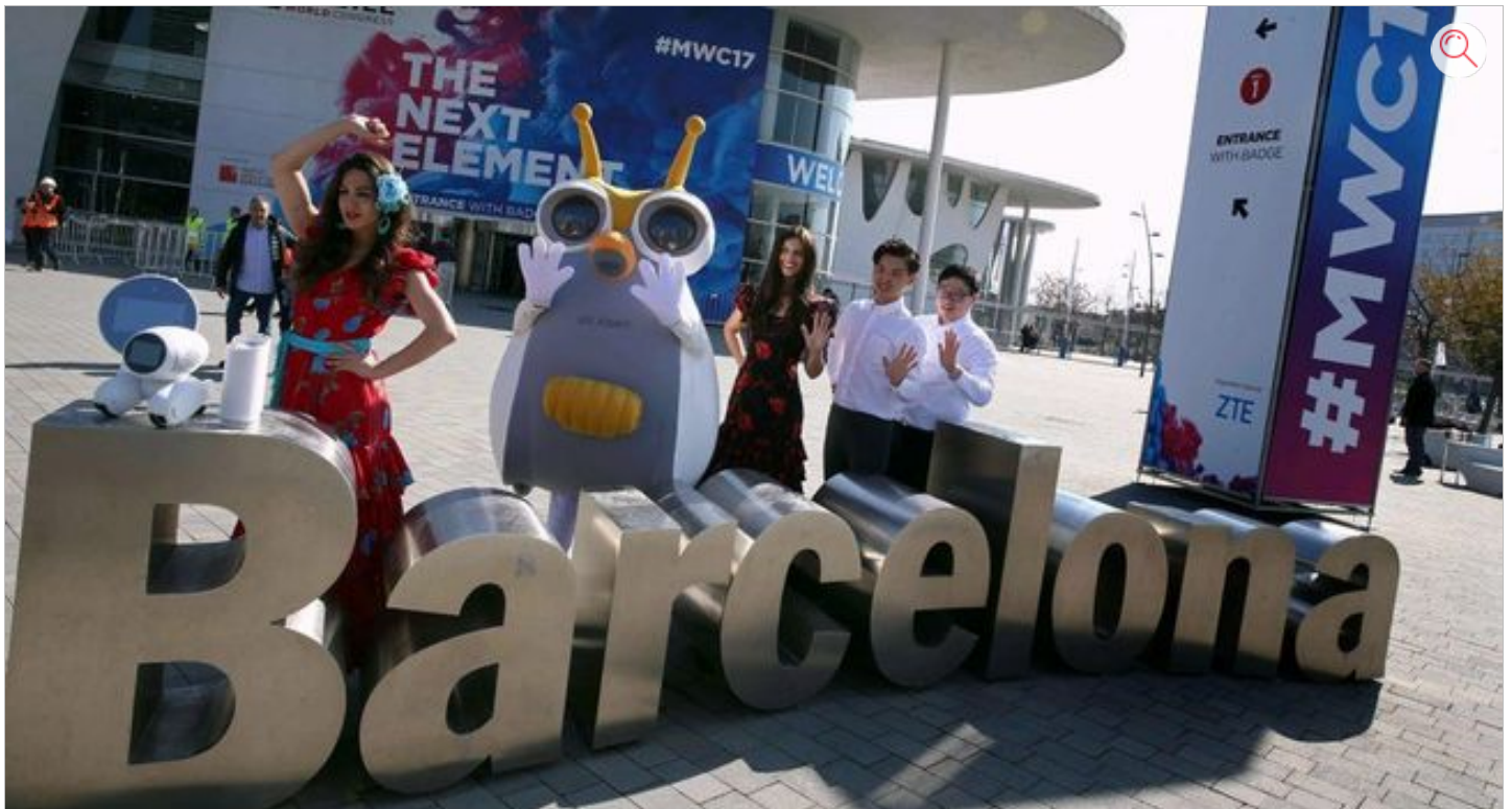
Barcelone accueille le Mobile World Congress cette semaine.

Le Mobile World Congress (MWC), le plus grand rendez-vous mondial de l'industrie mobile qui ouvre ses portes ce matin pour quatre jours, n'est que la pointe émergée de l'iceberg que représente le secteur des TIC (technologies de l'information et de la communication) à Barcelone. Cinquième hub technologique en Europe derrière Londres, Berlin, Paris et Amsterdam, Barcelone est en passe de devenir la Silicon Valley de la Méditerranée. La capitale catalane abrite aujourd'hui près de 12 800 entreprises spécialisées dans les TIC, 200 parcs technologiques et une dizaine de centres de recherche. Près de 25 000 personnes, issues du monde entier, souvent jeunes et hautement qualifiées travaillent dans un secteur en pleine expansion. Ces résultats sont le fruit des efforts conjugués des autorités publiques et des entrepreneurs locaux qui travaillent main dans la main depuis de nombreuses années.