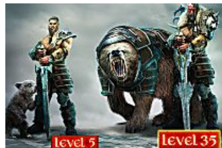
If you own a computer you must try this game (Vikings)