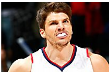
Re-Picking the Ridiculously Loaded 2003 NBA Draft (PointAfter | By Graphiq)