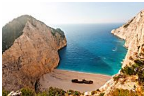
Les 10 plus belles plages d'Europe (Petit Futé)