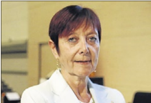
MARGARITA ARBOIX RECTORA DE LA UAB «Más opciones para investigar»

«La Agencia Europea del Medicamento traería más opciones para la investigación. Facilitaría la llegada de muchos científicos y beneficiaría los resultados en salud de los ciudadanos».