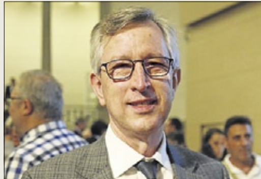
JOAN MASSAGUÉ INVESTIGADOR «La AEM y BCN, buena pareja»

«Barcelona es el gran hub de investigación y atención biomédica del sur de Europa. La AEM convertiría la ciudad en un gran foco de bienestar y riqueza para toda Europa».