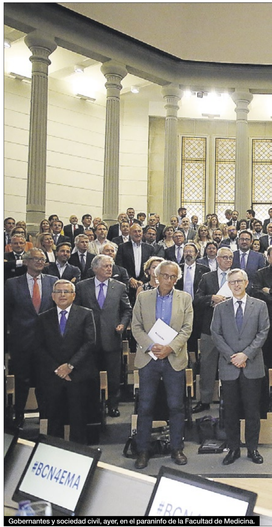
Gobernantes y sociedad civil, ayer, en el paraninfo de la Facultad de Medicina.

La ciudad que acoge la sede del medicamento recibe una media anual de 40.000 visitas por parte de científicos y técnicos vinculados al sector farmacéutico.