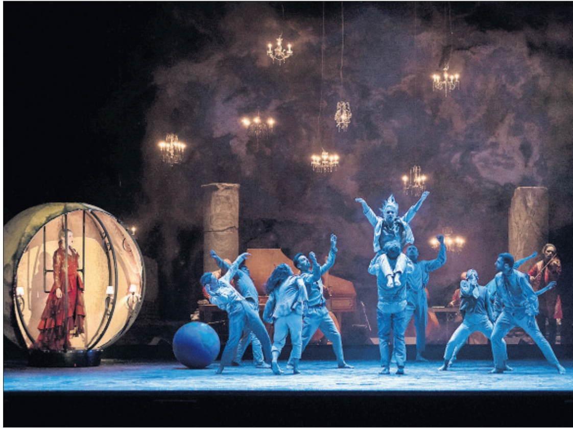
Un momento de Folia , el espectáculo inaugurado en Lyon que cerrará Peralada en agosto.

Del total ingresado por la tasa turística en este periodo de 2017 —el primer año que el consistorio gestiona el 50% de lo que se recauda en Barcelona por este impuesto— el Ayuntamiento destinará 1,9 millones en proyectos de mejora de la vida cotidiana en los barrios de la ciudad y otros 1,3 millones a proyectos de conocimiento, gestión y ordenación del turismo; 478.000 euros más a actividad turística y desarrollo económico y 447.971 a proyectos de turismo sostenible; por lo que el propio turismo y su gestión se benefician con la aplicación de esta tasa.