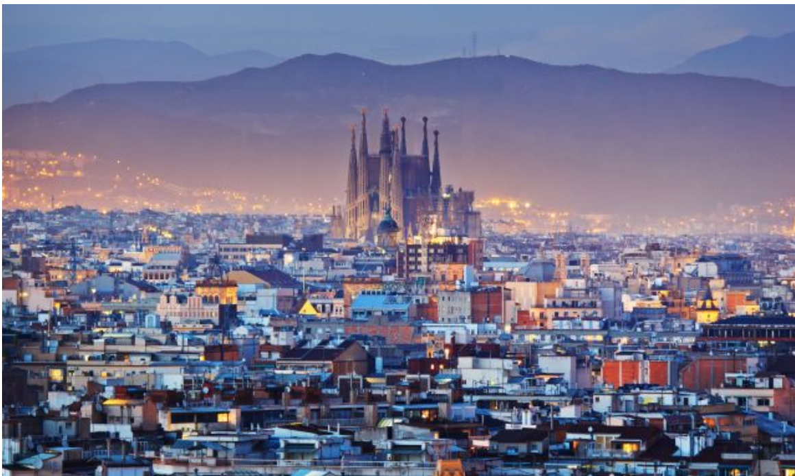
Imatge de l'skyline de Barcelona amb la Sagrada Família de fons