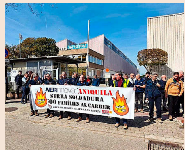
Protestas de trabajadores de Serra Soldadura.

Si finalmente ningún comprador aparece, Serra Soldadura desmantelará su planta y abandonará las instalaciones,